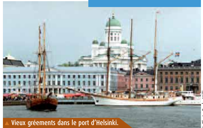
▲ Vieux gréements dans le port d'Helsinki.