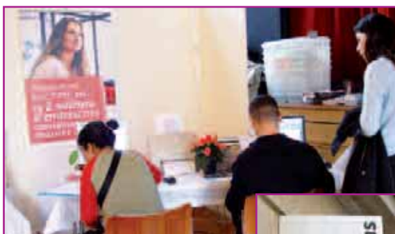
^ Forum emploi organisé par l'UIS à la Mairie du 6 e .

à la vie quotidienne des posent des services sur-