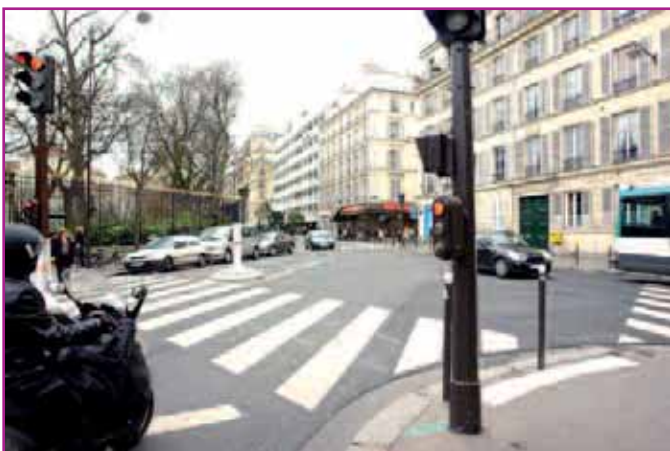
Dans le cadre de l'opération de sécurisation des abords du jardin du Luxembourg, le carrefour des rues d'Assas et Guynemer a été réaménagé.

identogènes de réaména- ours Assas- partie-Vieux-