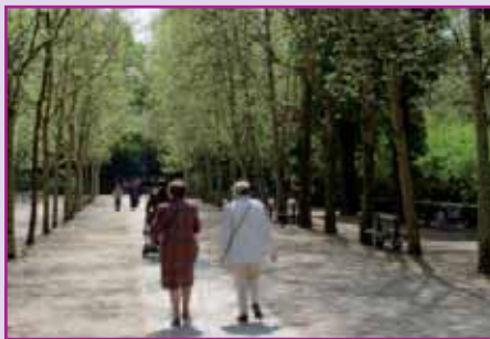
Renforcer la solidarité intergénérationnelle est une priorité pour la Municipalité.

- Rendre tous les équipements publics accessibles aux personnes à mobilité réduite.