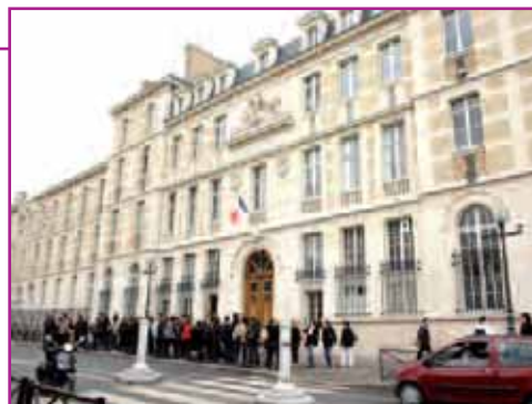
La restructuration du collège-lycée Montaigne se poursuit.

- La Municipalité continue d'aider les associations développant des activités périscolaires et des cours de soutien pour les élèves en difficulté.