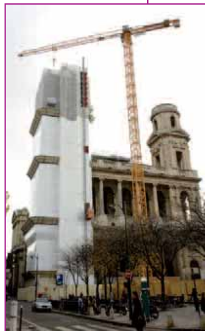
La rénovation de la Tour nord de l'église Saint-Sulpice durera 4 ans et demi.

- A travers une politique d'animation volontariste, la Municipalité soutient les manifestations majeures de la vie culturelle de l'arrondissement : Foire Saint-Germain et ses différents festivals (théâtre, poésie, poterie), "Le 6 e , Ateliers d'Artistes", L'Esprit Jazz, Marché Foire de l'Odéon, Parcours Rive Gauche, "Un livre, un café". De même, elle accueille chaque année une trentaine d'expositions.