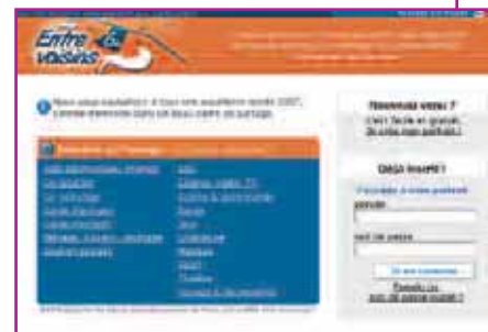
Entre voisins du 6 e , le nouveau service convivial et interactif accessible sur le site Internet de la Mairie du 6 e .

- La mise en place de commissions pour l'attribution des logements et des places en crèches.