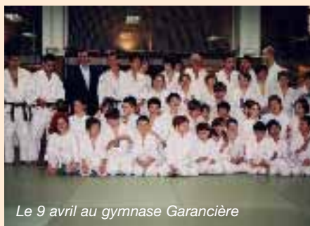
Le 9 avril au gymnase Garancière

Pour son anniversaire et avant la "photo de famille", le Kogakukan avait organisé deux cours collectifs de démonstration où