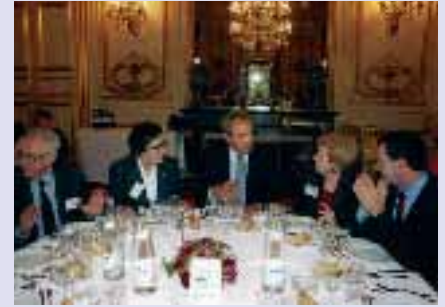
Le Professeur Bernard DEBRÉ, Député de Paris, a présidé le dîner annuel des Sociétaires du 6 e de la Légion d'Honneur dans les salons du Sénat.

Alors à vos dossiers, tentez votre chance !