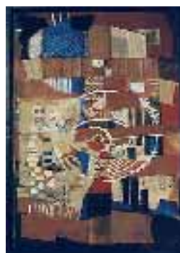
Tours et détours, collage de sable, carton papier journal et rehaut à l'acrylique, 117 cm X 65 cm, 1995.

L'ADEIAO (Association pour la défense et l'illustration des arts d'Afrique et d'Océanie) présente, du 26 octobre au 21 novembre, des peintures et sculptures de N'Guessan Kra, artiste d'origine ivoirienne.