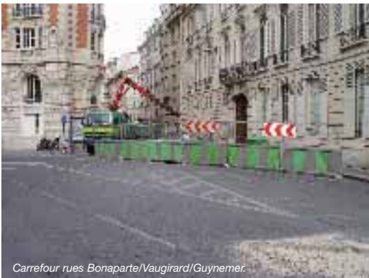
Carrefour rues Bonaparte/Vaugirard/Guyvermer.

Le carrefour Bonaparte/Vaugirard/ Guyvermer va être partiellement réaménagé : deux des musoirs vont être agrandis et dotés de barrières de protection.