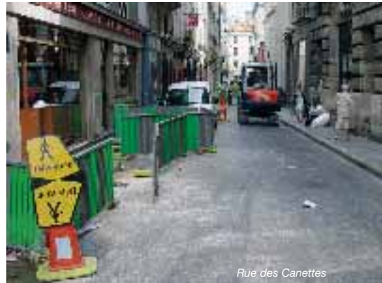
Rue des Canettes

D'ici à la fin de l'année, trois signalisations tricolores supplémentaires seront créées à l'intersection Condé/Vaugirard, Tournon/Vaugirard et à l'angle Raspail/Fleurus. Pour 2005, l'équipement du carrefour Fleurus/Guynemer a été demandé.